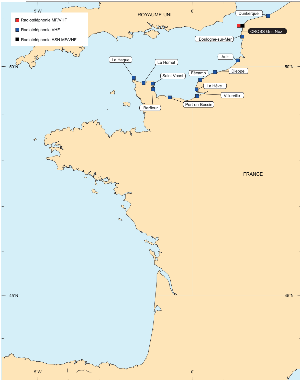
51.FR. — France - Manche/Mer du Nord - Stations.